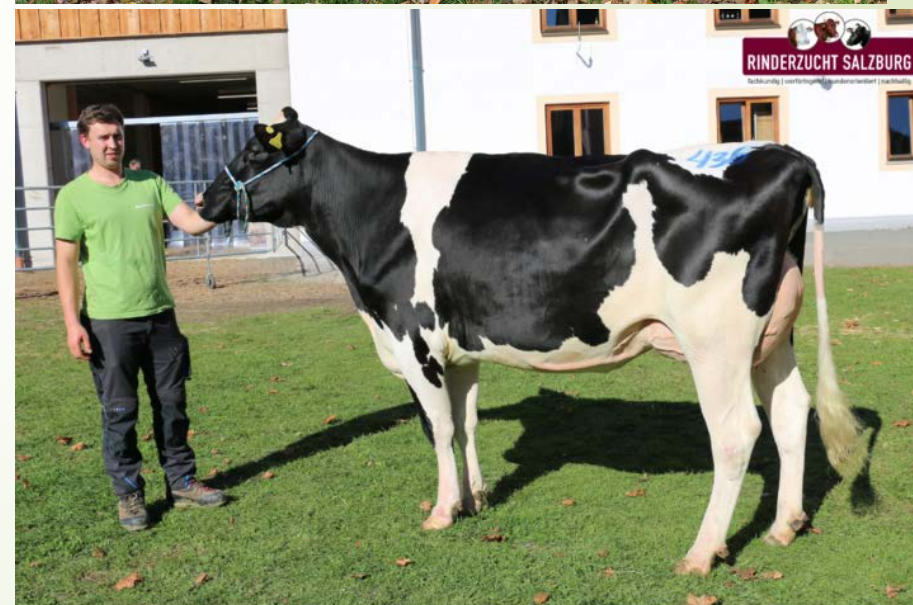
Kat.Nr. 436 (V. Hotspot) Haarbruck KG, Haarbruck, Nussdorf